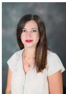
Universiteti Luigj Gurakuqi, Shkodër (UNISHK)