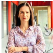
Drejtoreshë Ekzekutive SCiDEV