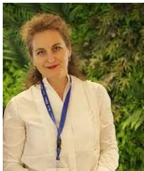
Mentore e Fushatës “Nga Fjala Tek Veprimi”