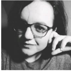
Mentore e Fushatës “Nga Fjala Tek Veprimi”