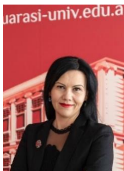
Trajnere për zhvillimin e kapaciteteve të studentëve