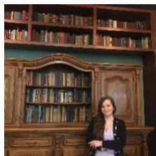
Asistente Projekti SCiDEV