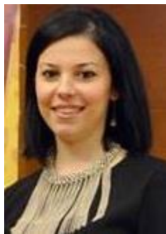
Fakulteti i Drejtësisë, Universiteti i Tiranës (FD/UT)