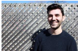
Trajner dhe Moderator SCiDEV

përfaqësues të nivelit të lartë të Komisionit Evropian. Në të njëjtën kohë, ajo punoi si studiuese për Institutin e Rajoneve të Evropës, një organizatë joqeveritare me seli në Salzburg.