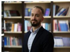
Universiteti European i Tiranës (UET)