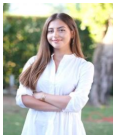
Trajnere dhe Moderatore SCiDEV